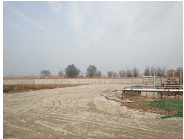
项目用地现状情况