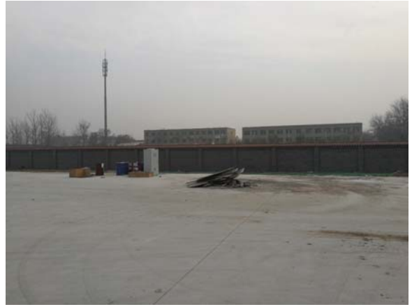
项目用地现状情况