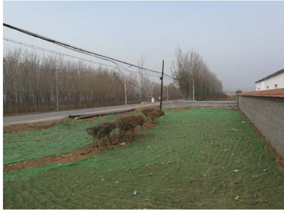
西侧道路及架空电力线