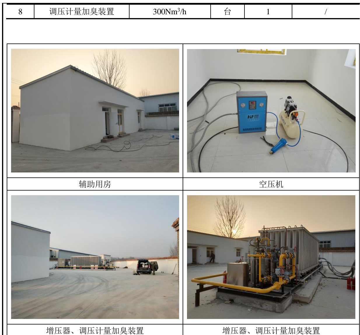
图2 站内主要建构筑物、主要设备