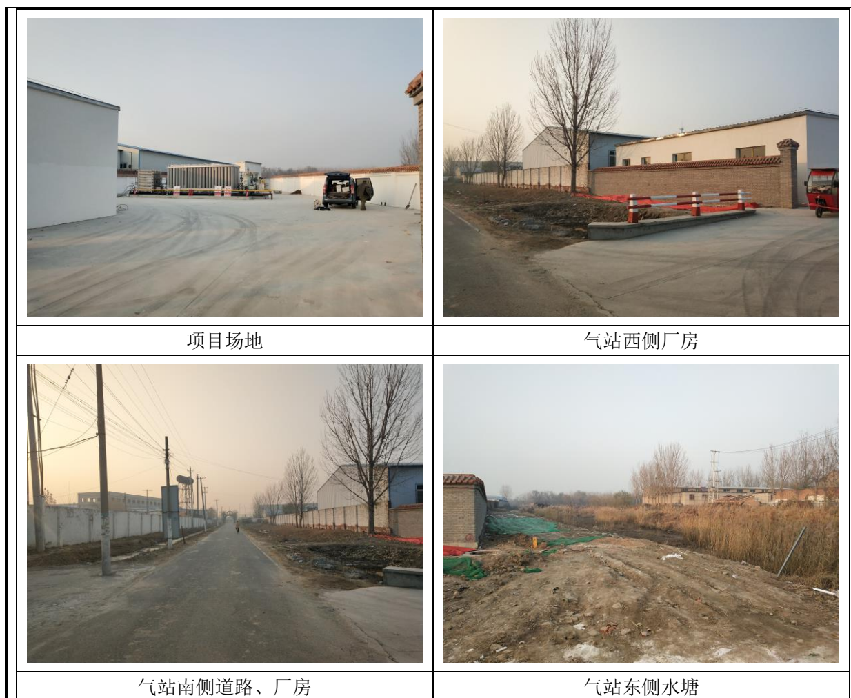
图 1 项目用地现状及周边情况