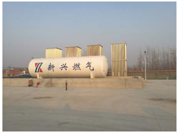
项目用地现状情况