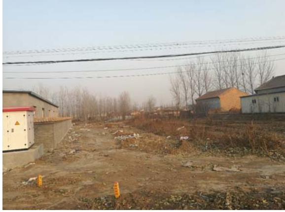
南侧空地、隔空地村庄